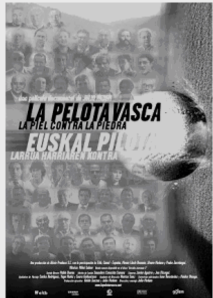
Cartel de la película.

Nosotros mismos, con el mismo material, podríamos haber hecho otro documental. Por ejemplo: Unas imágenes de miembros de ETA aprendiendo a disparar, con un agudo sonido de alboka simulando un llanto infantil y las palabras de Otegi de fondo diciendo: